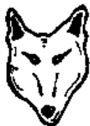
DET DANSKE SPEJDERKORPS